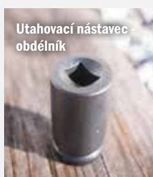
Utahovací nástavec obdelník