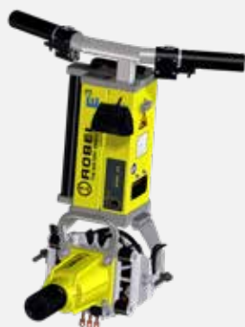
ROMPACT 30.20 (proved. 03) - 7809900006