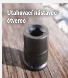
Utahovací nástavec - čtverec