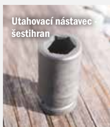
Utahovací nástavec šestihran